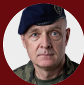
Gen. Piotr Błazeusz