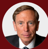
Gen. David H. Petraeus