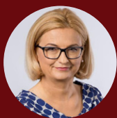
Amb. Irena Lichnerowicz