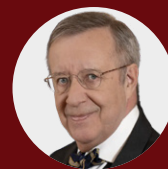
Prof. Toomas Hendrik Ilves