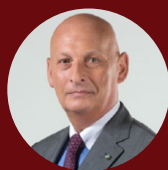
Amb. Tomasz Orłowski