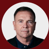
Gen. Ben Hodges