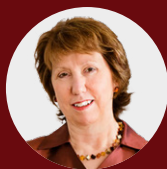
Baroness Catherine Ashton